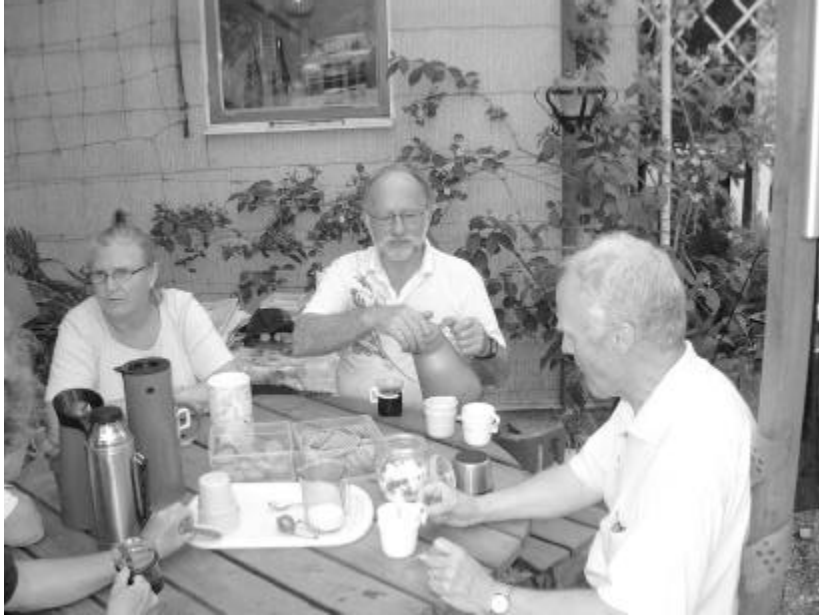
Stig och hans fru bjuder på kaffe

Förutom att dela med sig av sitt stora vetande bjöd även han och hans fru på kaffe med dopp vilket vi uppskattade.