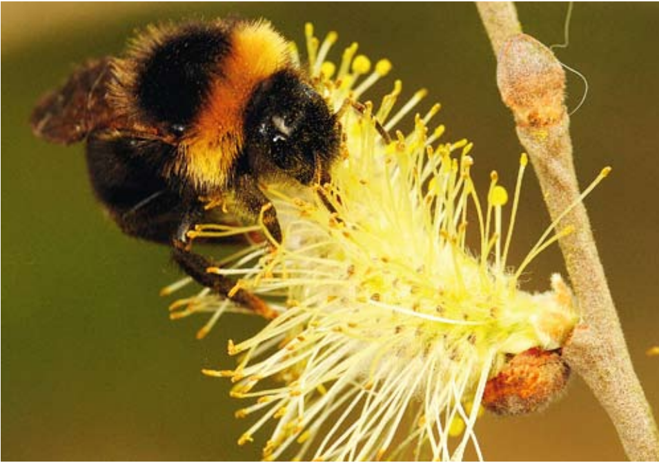
Jordhumledrottning, Bombus terrestris , på sälgblomma. Humledrottningarna är beroende av nektar för att tillgodose sitt eget energibehov av både pollen och nektar för bobyggandet och uppfödandet av den första kullen larver.