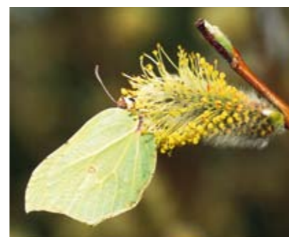
Många övervintrande dagfjärilar suger nektar från sälglommorna på våren; här en citronfjärilshona, Gonepteryx rhamni .

Varje vår kan vi förundras över de vackra gulblommande buskarna och träden som lyser upp skogskanten efter den mörka vintern. Om man går nära, kan man se att blommorna på olika träd och buskar inte är lika. På vissa finns bara blommor med pistiller och på andra bara blommor med ståndare överfulla med mjöligt pollen. Det beror på att sälg och övriga videarter är skildkönade – antingen är de hannar eller honor. Denna artikel handlar om sälgen, men det vi tar upp här, rör även de andra videarterna.