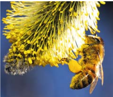
Ett honungsbi, Apis mellifera , tankar pollen från en blommande sälg.